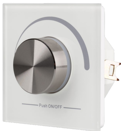
022516 Панель Rotary SR-2836N-B-RF-IN