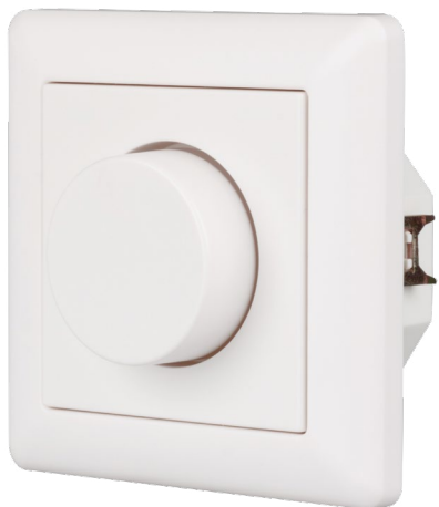
022155 Панель Rotary SR-2836N-A-RF-IN