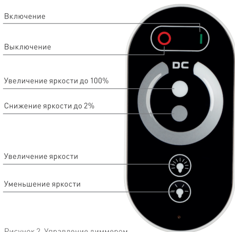
Рисунок 2. Управление диммером.